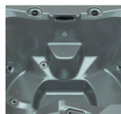
Sterling Marble Pearl Shadow Silver